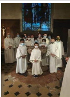
Enfants de chœur représentant les paroisses de tout le secteur, le jour de la messe de rentrée.

ÉVEIL A LA FOI eveil.foi.longjumeau@gmail.com 06 86 27 67 52